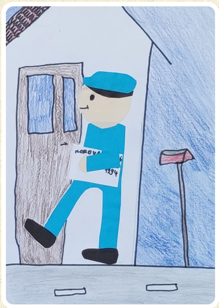
Žan Pobiljšaj, 4. e