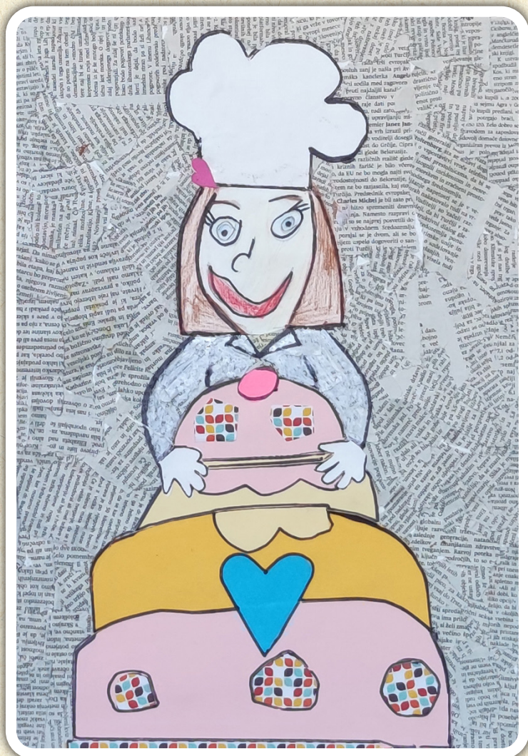
Nika Podlogar, 2. a