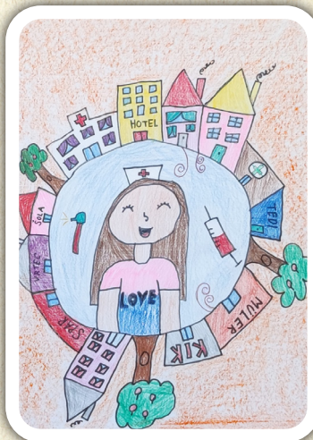
Aurora Primrose Wibowo